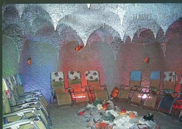
人工的に造られた塩洞窟(東ヨーロッパ)

天然の塩の洞窟は古くから気管・皮膚によい場所とされていますが、その理由として、空気に含まれる塩分の微粒子が、呼吸から胸に入り、また皮膚に吸着します。塩分はミネラル（カルシウム・カリウム・マグネシウム等）及びヨードを多く含んでおり、同時に殺菌効果や粘膜の浄化作用があり皮膚・口腔・咽頭粘膜を清潔にします。ヨーロッパでは、古くから塩の洞窟を利用した病氣療養や健康増進のためのストレス解消への取り組み（ハローセラピー）が盛んでした。その効果効能は下記とされています。