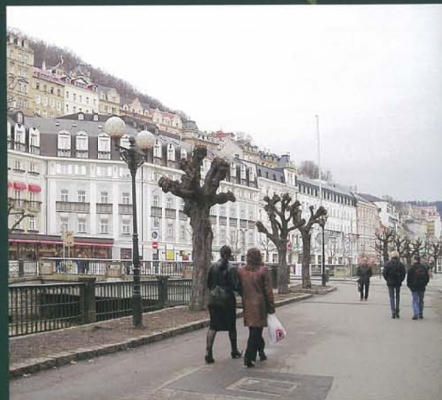
市街地の健康増進施設ではハローセラピーが目的の利用者も多い

ポーランド・エヴァレット社のガロスの洞窟は、ウクライナで15年の科学的調査とポーランド国内での5年間の研究を経て開発されました。このユニークな空間は2000年から販売展開され、アメリカでもシカゴに設置されるなど世界100カ国以上で特許取得済みです。