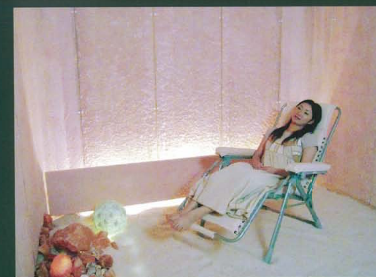
塩の部屋「いやしんす」(写真上)と内部(写真下)